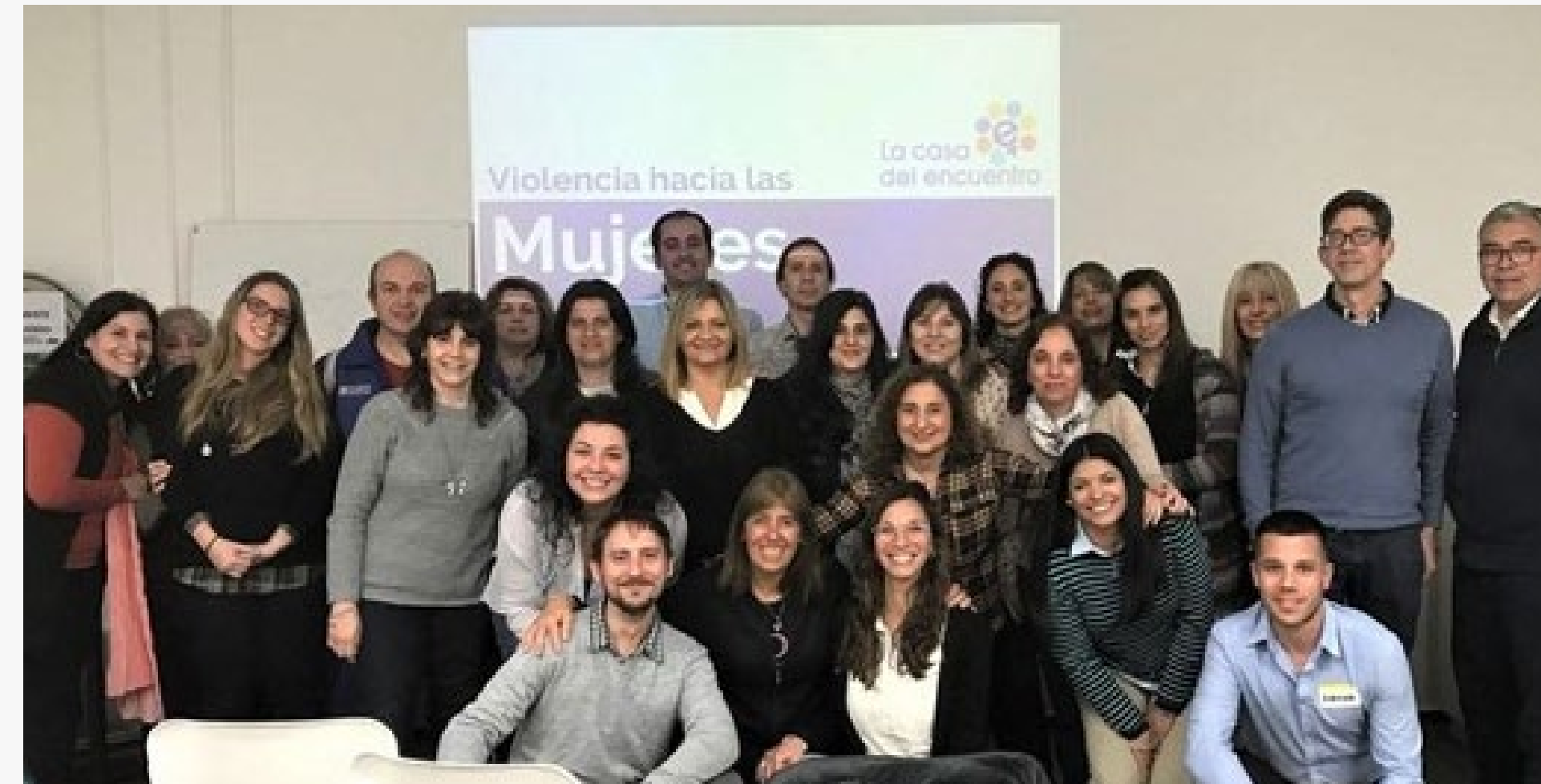
Capacitación en violencia de género junto a La Casa del Encuentro.